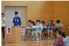
提案する児童会本部の皆さん

3年生以上の児童が体育館に集まり、今年度の児童会活動について、活発な話し合いが行われました。今年度のテーマは「きずなパワーで明るい笑顔の池田小！」です。このテーマのもと「きもちよいあいさつ」「ずばっと責任」「なかよくいじめ0(ゼロ)」に取り組むことになりました。これらのはじめの字をとると、「きずな」になりますね。よく考えました。児童会の提案に対しては、各学級から、「無言清掃」「池なか集会」などのやり方や内容についてたくさんの意見や質問が出されました。