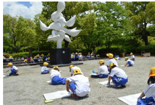
広場で「樹人」を描く、1年生

18日(木)には、1年生が美術館に行きました。学校の近くにある施設ですが、普段行かないところに入れたり、ヨーロッパの絵画を解説してもらいながら見たりすることができました。外でも彫刻のスケッチをしたり、仲よくお弁当を食べたり、楽しく過ごすことができました。