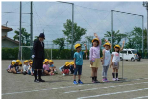
「右よし、左よし…」1年生の様子

この日は、1年生が横断歩道の渡り方を、3年生が自転車の乗り方について、校庭に描かれた道路や横断歩道を使って学習しました。