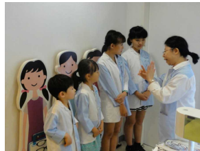
メガネ屋で働いています

3日目にまず行ったのは、今話題の豊洲にある職業体験施設で「キッズニア東京」です。中には、国内の名だたる企業がパビリオンを出していて、様々な職業体験ができるようになっていました。約4時間の滞在時間で、平均5～6つの職業を体験した子どももいたようで、将来の夢や希望がもてたのではないのでしょうか。