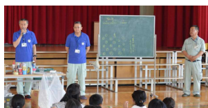
ゴミへらし隊の皆さん

6月には各学年の学校開放日があり、どの学年も親子活動に取り組んでいます。3年生は、甲府市環境部の”ゴミへらし隊”の方をお招きして「エコ工作」に取り組みました。家庭から持ってきたペットボトルに紙粘土を巻き付けたり飾りや形を工夫したりしてかわいい小物入れができあがりました。