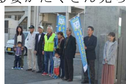
保護者や地域の皆さん