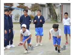
西中生徒による指導の様子

10月16日には、西中の陸上部と野球部の生徒が、後輩の指導のために池田小に来てくれました。