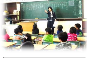
見つけた子いるかな? ハーイ