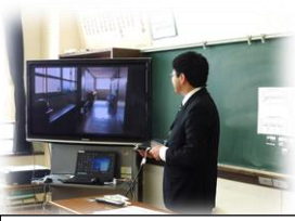
大型テレビを使ってわかりやすく