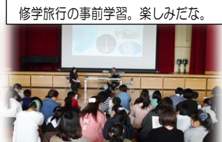
修学旅行の事前学習。楽しみだな。