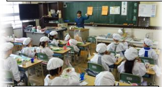
初めての給食、おいしかったよ

※ 給食は栄養面だけでなく、協力して準備や片付けを行うことの大切さを学んだり、給食に携わる給食室の方々ははじめ生産者や流通の方々などへの感謝の気持ちを育んだり多くの教育的価値のある活動です。ご家庭でも給食のことを話題にするなど、これからも好き嫌いをなく給食を楽しんでほしいと思いました。