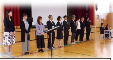
新役員の皆様、よろしくお願いします。

○ 4月19日（金）、保護者の方々にはお忙しい中、本年度初めての授業参観に多数ご参加いただきありがとうございました。親子で共に行う活動、班での話し合い、ICTの活用等々、多彩な姿が見られ、新学習指導要領の完全実施を来年度に控え、本校でこれまで行ってきた研究の成果を生かされている学習だと感じました。今後とも子どもたちの学習や生活の様子について、ご家庭でも話題の一つとして取り上げていただき子どもの話に耳を傾けてくださると本当にありがたく思います。子どもたちの大きな励みになります。 ○ 併せて行ったPTA総会、学級懇談、学年総会にも、多くの保護者にご参加くださりありがとうございました。PTA総会では、職員の紹介の後、本年度の活動計画案、予算案が審議され、原案通り可決されました。また、新役員も承認されました。旧役員の皆様、今までありがとうございました。これからは、新役員の皆様方を中心に、池田小PTA活動を盛り上げていってください。