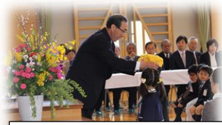
黄色い帽子贈呈式 安全に来ようね

○ 満開の桜に祝福された入学式では、広い体育館にドキドキワクワクしていた1年生でしたが、そこはさすが子ども、徐々に学校生活にも慣れてきたようで、元気に返してくれるあいさつやハイタッチに、池田小の子どもになってきたなと感じることが多くあります。休み時間には校庭で友達と元気に遊ぶ姿も見られるようになりました。学校では、幼稚園や保育所の生活から、学校生活に徐々に慣れていくことができるように、4～5月は「スタートカリキュラム」を実施しています。ご心配なことがあれば担任にご相談ください。16日（火）からは、楽しみにしていた給食が始まりました。この日は「入学お祝い給食」と題して、メニューは「チョコクルクルパン、から揚げ、カラフルサラダ、ポトフ」でした。おいしかったかな?! 6年生、応援ありがとう!!