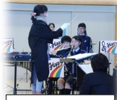
気分はマエストロ

保護者や地域の皆様も大勢ご参加くださり、手拍子等で盛り上げて下さり本当にありがとうございました。池田の子は本当に幸せです。