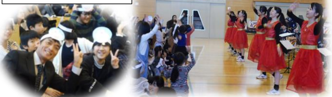
ドラちゃんをつけて、チース